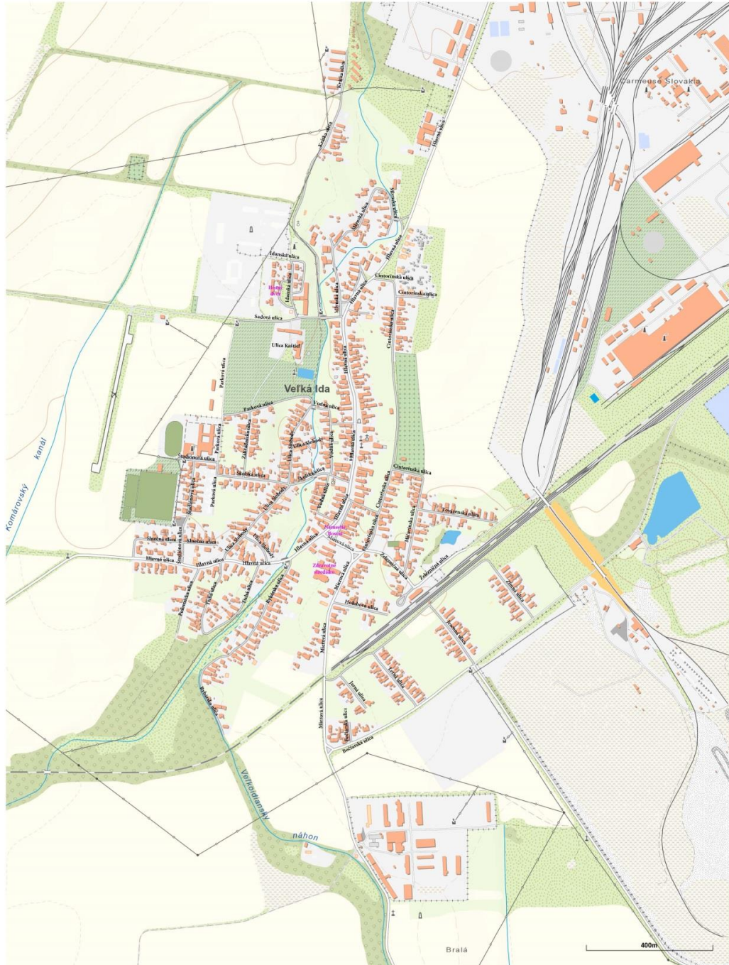
Mapa obce Veľká Ida