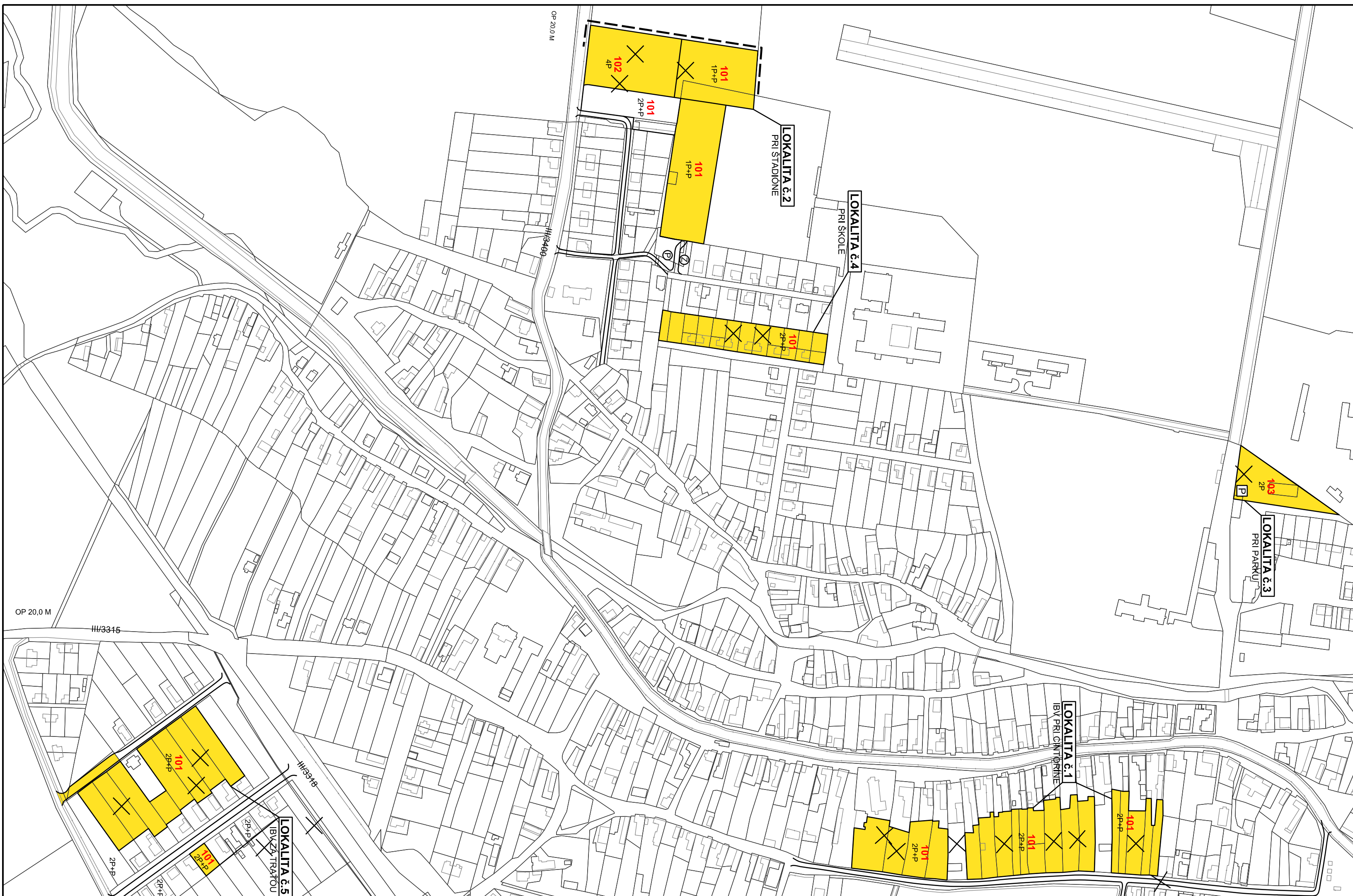
SCHÉMA ZÁVÄZNÝCH ČASŤÍ RIEŠENIA